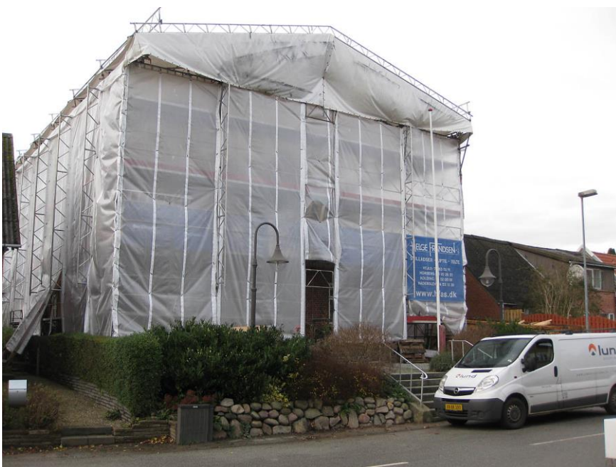
November 2015: Forklædt og indpakket til vinterbyggeri går forsamlingshuset en ny epoke i møde. Den begynder efter planen 1. april 2016.