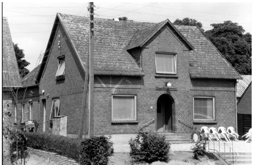
Noget kedeligt af udseende. Sådan stod Borum Forsamlingshus i 1992.