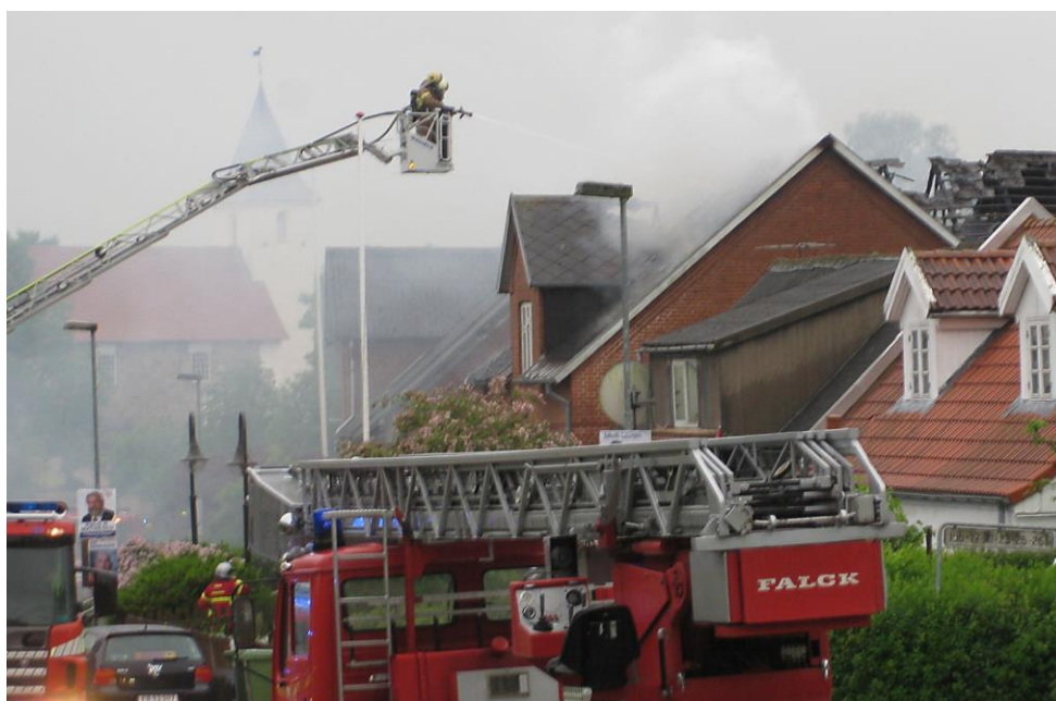
Brandstedet fotograferet, da de åbne flammer var slået ned.