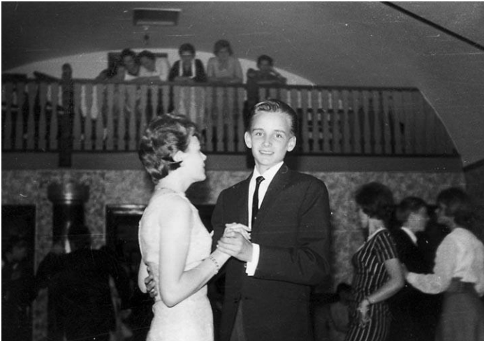
1965. Der danses i salen, der endnu har kakkelovn og en balkon hen over indgangsdøren.